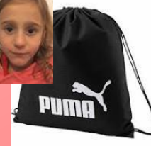
SAC A CRAMpons