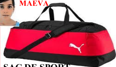
SAC DE SPORT